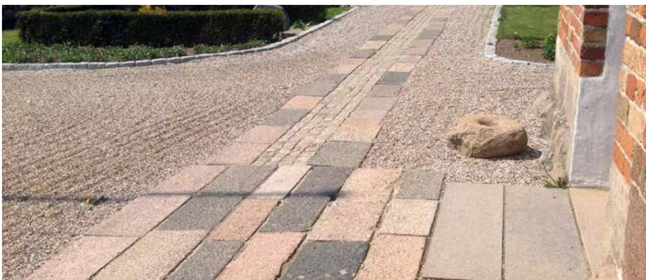
Gamle sokler og nye chausséstén har forbedret tilgængeligheden på Vissing Kirkegård.

Tekst og foto af Julie Krogh, jbjk@hadstensogne.dk Kommunikationsmedarbejder, Hadsten Storpastorat