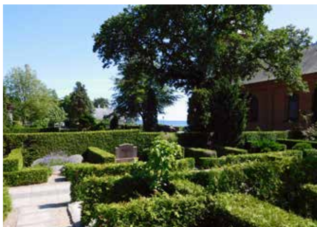
Egebæksvang Kirkegård er fra 1896 og er udvidet af 2 omgange.

"Over 41 års ansættelse i folkekirken! Et valg jeg aldrig har fortrudt"