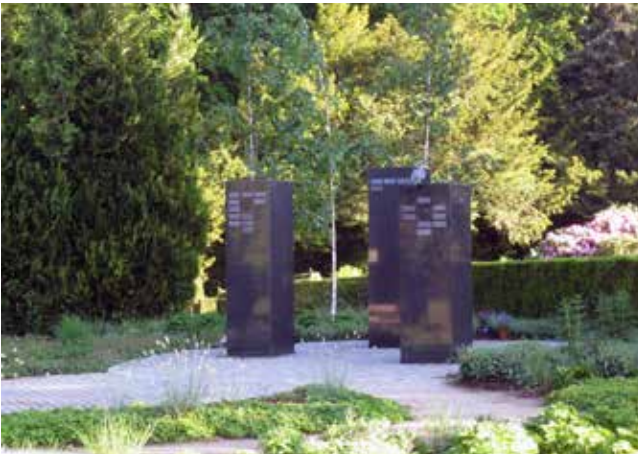
I resten af Birkehaven kommer der i løbet af sommeren forskellige stauder, som for eksempel Sankt Hansurt, Purpur Solhat, Katteurt og Geranium samt græsser.