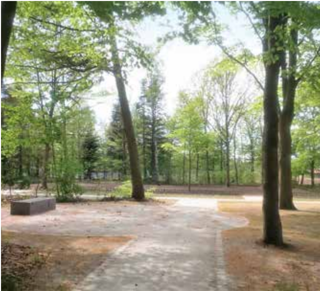
Foran afdelingen er anlagt en cirkulær bede plads, og opsat en granitplint, som kan benyttes i forbindelse med begravelser.