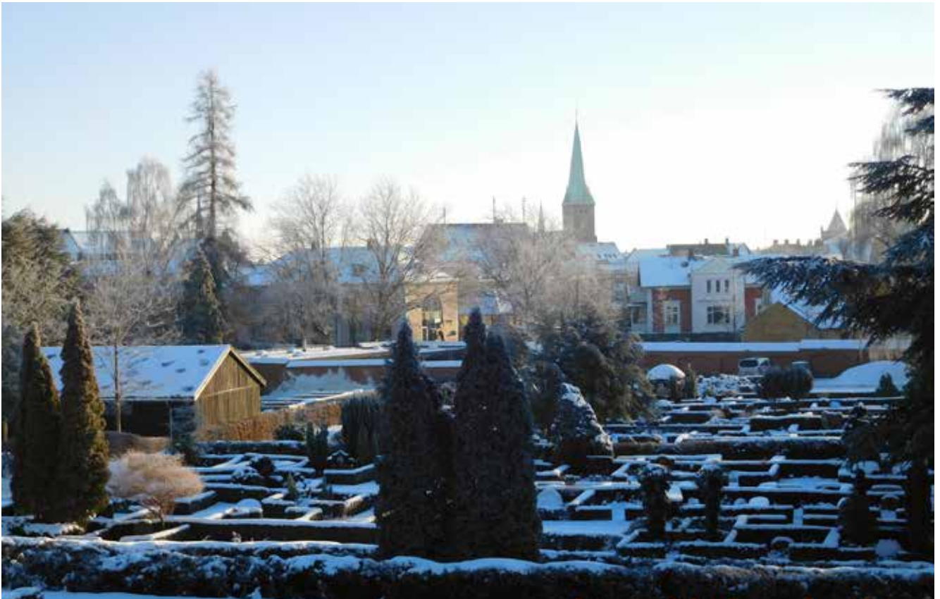
Helsingør Kirkegård er på 69.000 m 2 og ligger i et kuperet område midt i byen.

skulle køres med toget fra København til Roskilde, og alle landets kirkeklokker skulle ringe under denne togtur. Far og jeg delte denne tjans, den ene trak i snoren, mens den anden sad i våbenhuset med en transistor radio og lyttede: Vi skulle høre radio, for her blev togturen kommenteret direkte. Så lød det i radioen "Nu er Kong Frederiks båre ankommet til Roskilde banegård." Og straks herefter stoppede alle landets kirkeklokker.