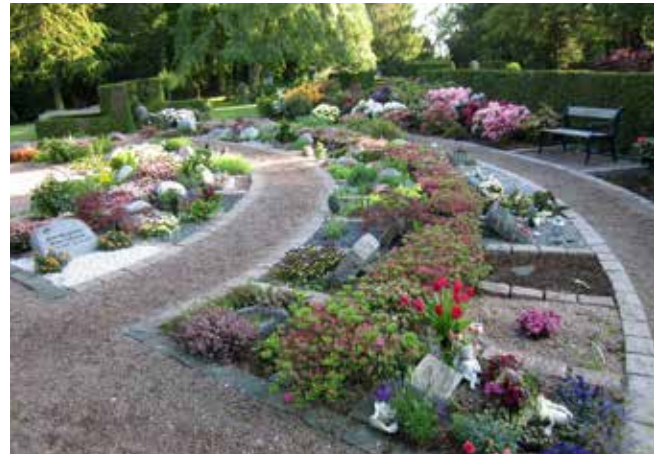
I naboafdelingen finder man Azaleahaven, som ligeledes er en smuk have med små urnegrave. Selve haven er beplantet med små dværgazaleaer i rosa-pink farver, hvilket er en fryd for øjet.