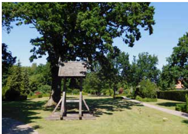
Klokkestabelen på Egebæksvang Kirkegård.