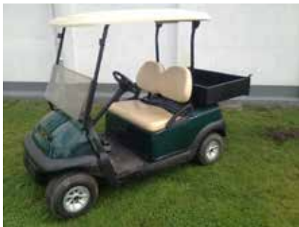
Club Car Precedent m/lad

Du kan kontakte Dkelcar på 51954026. For pris eller tilbud.