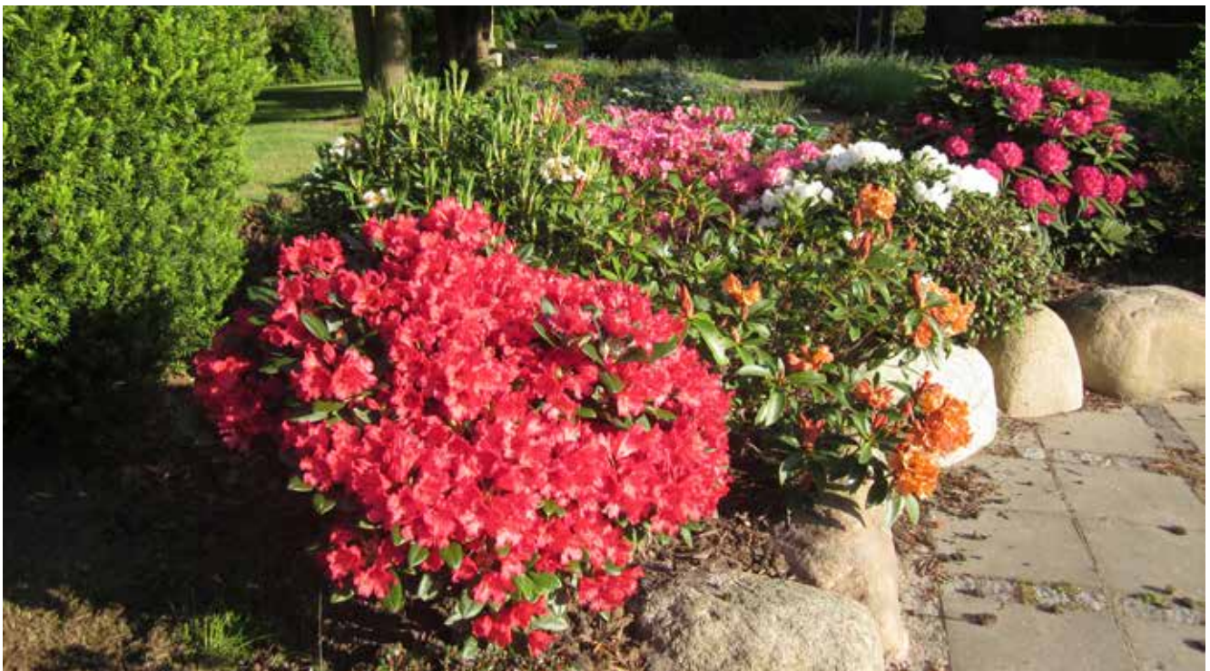
På parkeringspladsen ved kontoret bliver man, som besøgende og gæst, budt velkommen af flotte rhododendron, som nu står i fuldt flor.

Med billeder har vi valgt at fokusere lidt på de flotte, blomstrende rhododendron og andre buske. ■