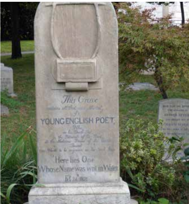
Blandt kirkegårdens mere kendte personligheder, er de engelske digtere John Keats og Percy Shelley. John Keats døde af tuberkulose under sit ophold i Rom. Han er begravet på den gamle del af kirkegården, under et anonymt gravminde, der bl.a. bærer indskriptionen "Here lies one whose name was writ in water".