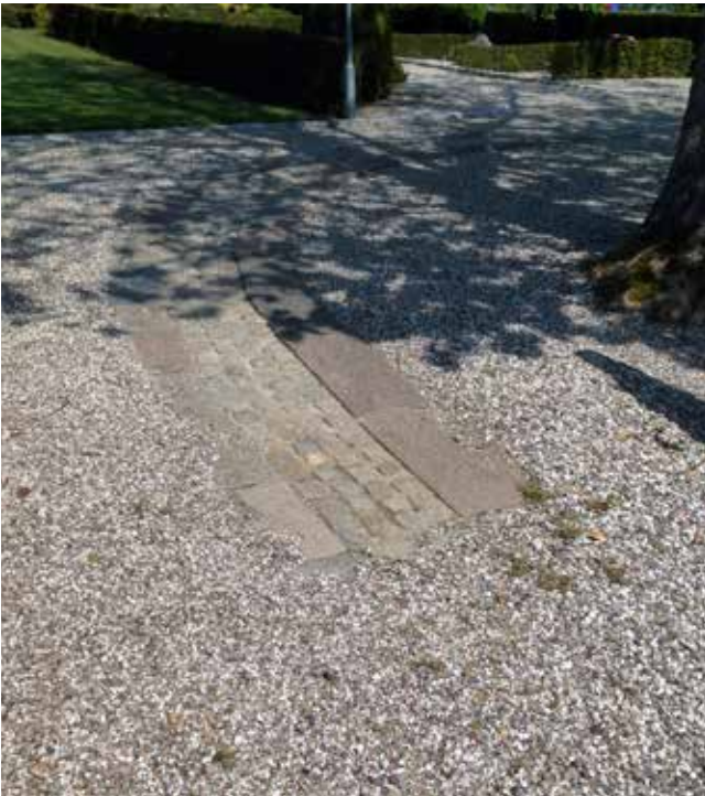
Vissing Kirkes tilgængelighedssti er kun halvvejs i mål: Gamle sokkelsten søges fortsat...

ned mellem sokkelstenene. Egentlig ville man gerne have lagt gamle chaussésten ned, men det var for omkostningsfuldt. Omkostningerne ved projektet er da heller ikke til at komme udenom. Anlægning af stien løb op i kr. 110.000 på grund af det store arbejde med at lægge sokkelstenene. Det er ikke bare lige sådan at få så forskellige sten til at ligge jævnt, og der skal også benyttes en speciel form for sand. Heldigvis kunne Favrskov Provsti se fornuften i en tilgængelighedssti på Vissing Kirkegård, og en sum penge blev bevilget.