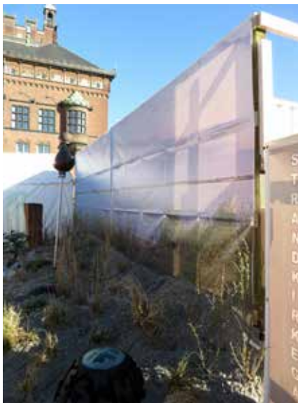
Strandkirkegården fra udstillingen 'Fremtidens kirkegårde', kunne ses på Rådhuspladsen i dagene 5. – 8. maj.

Interview med Ulrik Christiansen - af Lene Halkjær Jensen, lene.bladet@mail.dk