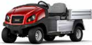
Club Car Carryall 500