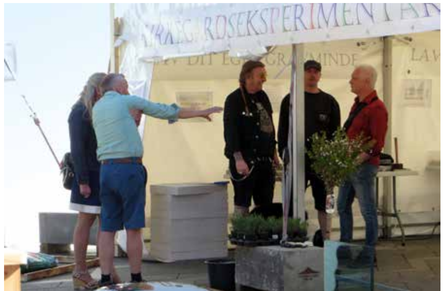
Flere af de forbigående benyttede lejligheden til at få en snak om gravminder, kirkegårde og det at forholde sig til døden.