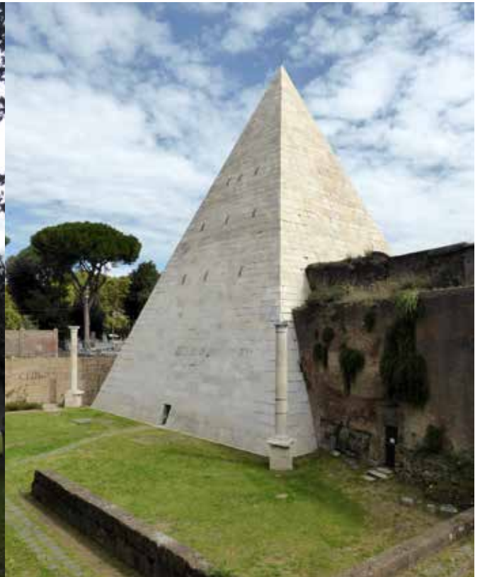
Cestius-pyramiden blev opført omkring år 12 før Kristus, som et gravmæle for en højtstående romersk embedsmand, Caius Cestius. Pyramiden kom senere til at indgå som en del af Kejser Aurelians bymur.