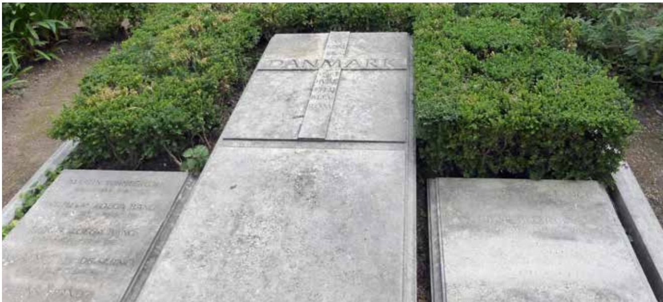
Under den fælles inskription 'Vi kom fra Danmark, vort hvilested blev Rom', ligger her flere danskere begravet.