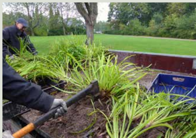
Skovfrytle danner hurtigt en tæt måtte af rødder – og den sidste deling foregik med både spade, økse og kniv.