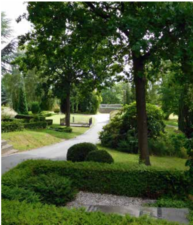
Alle stier på Helsingør Kirkegård er renoveret indenfor de seneste år.