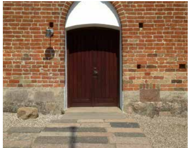
Det har været et stort arbejde at få en jævn belægning ud af de gamle uens sokkelsten, der passer smukt ind med den gamle middelalderkirke.