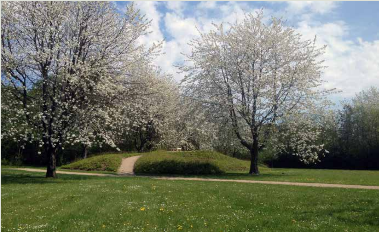
Den nye bakke på Torpen Kirkegård er lavet af affaldsjord og er tilplantet med Skovfrytle af "egen avl".