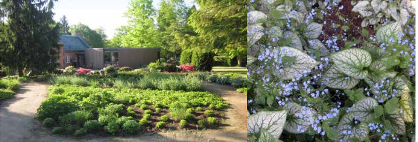
Bag bedet ses Birkehaven, som er en urnehave med mindesøjler og staudebede, hvor Kærmindestøsteren viser sine smukke, lyseblå blomster lige nu.