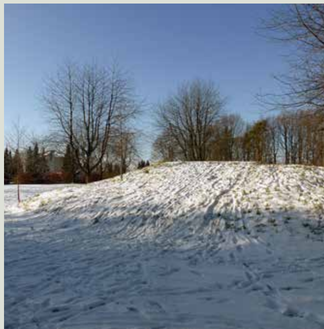
I vinteren 2016 fik bakken en sekskantet bæk af egsveller – og blev taget i brug som kælkebakke.

tæt måtte af rødder, der ikke slipper meget andet igennem, når den først er etableret. Skovfrytle blomstrer i maj-juni med brunlige aks, der bliver ca. 60 cm. høje. Hvis bladene bliver brune og triste i løbet af vinteren, kan de klippes af tidligt på foråret. Skovfrytle trives i både sol og skygge.