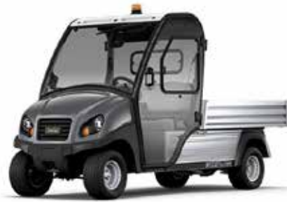
Club Car Carryall 700

Du kan også få finansieret dit næste køb, af arbejdsbil eller alm. Golf bil på op til 75.000 kr.