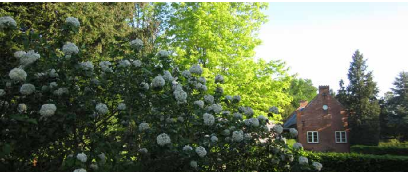
Går man videre rundt på Hørsholm Kirkegård, finder man på sin vej Duftsnebollen, der blomstrer i maj måned og dufter fantastisk.