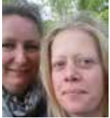
Tekst og foto: Katja K. Hansen og Mikala Fallesen, Hørsholm Kirkegård

Hørsholm Kirkegård er over 200 år gammel, og den bærer præg af at have Arboretet som nabo. Den tidligere kirkegårdsleder var nemlig ansat på Arboretet før tiden på kirkegården, og derfor finder man utrolig mange spændende træer og buske. Her kan nævnes Acer-familien (løn), som danner en karakteristisk ramme om kirkegården.