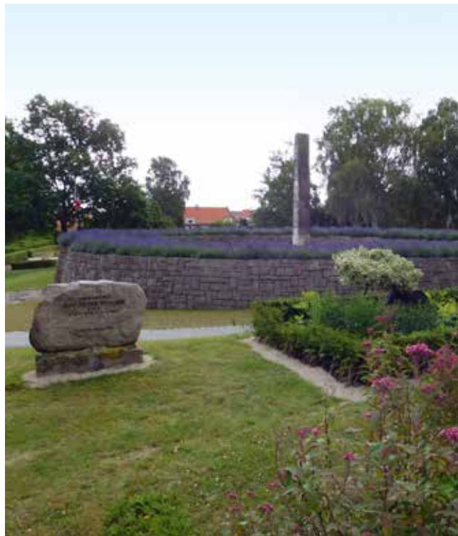
De franske kriggrave på Helsingør Kirkegård.

der stod ved roret. Egebæksvang Kirkegård er fra 1896, og udvidet af to omgange, sidst i 1952.