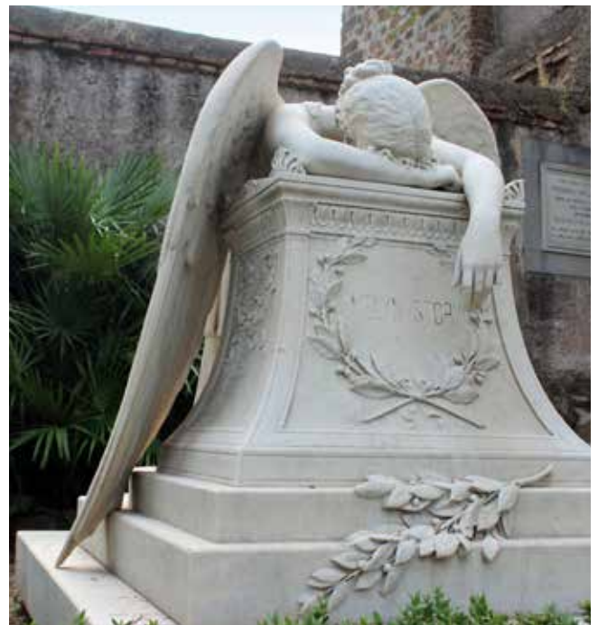
Emelyn og William W. Story's gravsted med skulpturen 'Angel of Grief'; udført og rejst af William Story selv, til minde om hustruen Emelyn. Han er bl.a. kendt for at stå bag tegningerne til den endelige udformning af Washington-monumentet.